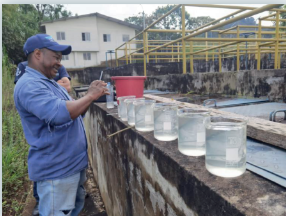
Prueba de Jarras

Curpac: Se realizó puesta en marcha de la PATP con la comunidad, transfiriendo la experiencia en la operación y mantenimiento de cada una de las estructuras de la PATP, se establecieron las recomendaciones para la gestión comercial y manejo de cartera.