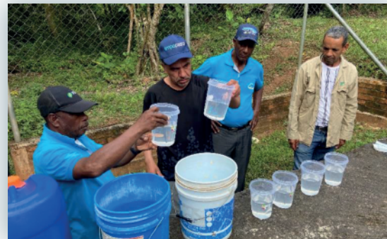
Pruebas en planta

San Quepal: Evaluación de las capacidades de tratabilidad de la planta, transferencia del conocimiento en la operación y control de la PATP.