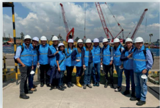
Visita de Aguas de Manizales S.A. E.S.P. a la Empresa de Acueducto y Alcantarillado de Bogotá E.A.A. E.S.P