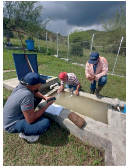
Dosificación en planta